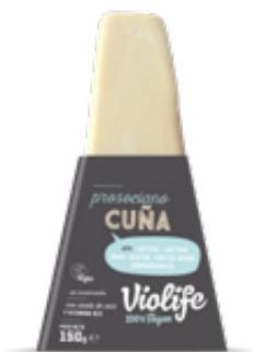
BLOQUE SABOR PARMESANO 150g