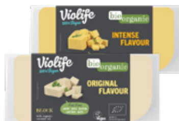
BLOQUE ORGÁNICO SABOR ORIGINAL O INTENSO, 150g