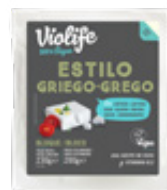
BLOQUE ESTILO GRIEGO 200g