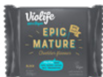
BLOQUE EPIC MATURE SABOR CHEDDAR 200g