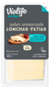
LONCHAS SABOR SEMICURADO 200g