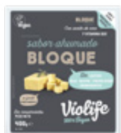
BLOQUE SABOR AHUMADO 400g